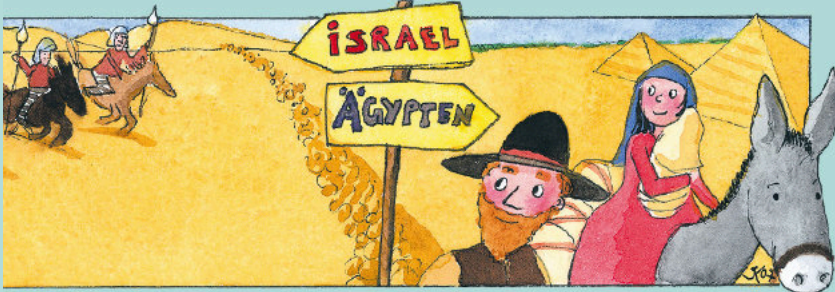
Auflösung: Ein Engel.

Bibelrätsel: König Herodes wollte das Jesuskind töten. Doch Josef wurde gewarnt. Er floh mit dem Jesuskind und Maria nach Ägypten. Wer hatte ihn gewarnt?