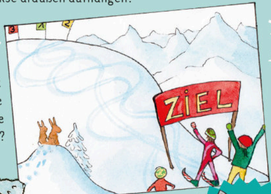
Der Skifahrer mit der Startnummer 1.

Rätsel: Wer ist im Rennen die kürzeste Strecke gefahren?