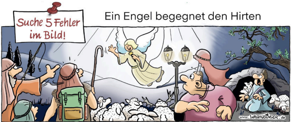
Engel, Schulranzen, Mikrofon, Geweih, Laterne

Jesus Christus spricht: Liebt eure Feinde;